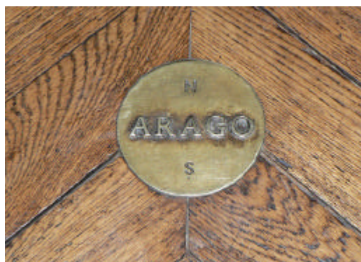
Légende : Un médaillon de la méridienne Arago, à l'Observatoire de Paris (on peut aussi en voir dans le jardin du Luxembourg).